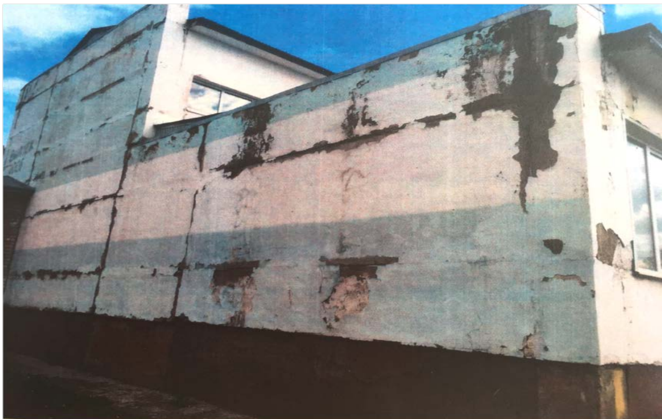
Фото до ремонта:

- капитальный ремонт Школы выполнен в полном объеме: произведена замена оконных блоков, ремонт полов на 2 этаже начальной школы, ремонт фасада, наружная облицовка стен сайдингом, установка дверей, обустройство помещения медицинского назначения в корпусе А, полностью заменена электропроводка и электроосветительные приборы.