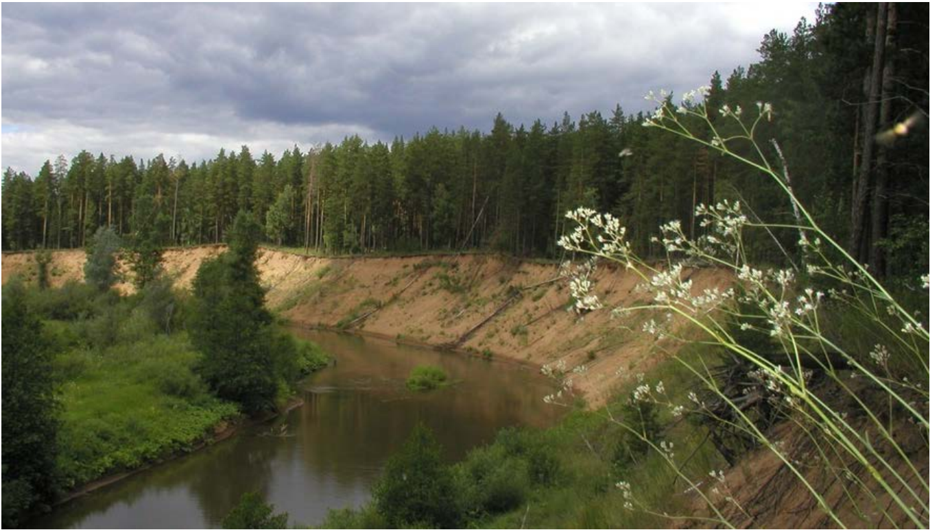
Бузулукский бор. Река Боровка